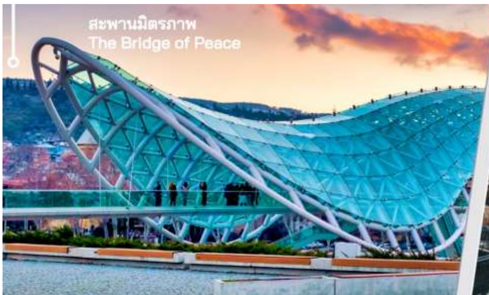
สะพานมิตรภาพ The Bridge of Peace

นำท่านเดินทางไปยัง สะพานสันติภาพ เป็นสะพานคนเดินรูปทรงโค้งสร้างจากเหล็กและ ทอดข้ามแม่น้ำคูราเชื่อมสวนริเกกับเมืองเก่าในใจกลางกรุงทบิลิซีนับตั้งแต่เปิดให้บริการในปี 2010 โครงสร้างนี้ได้กลายเป็นทางข้ามคนเดินที่สำคัญในเมืองรวมทั้งเป็นสถานที่ท่องเที่ยวที่สำคัญและเป็นหนึ่งในแลนด์มาร์คที่เป็นที่รู้จักมากที่สุดของเมืองหลวง สะพานซึ่งทอดยาว 150 เมตร ข้ามแม่น้ำคูรา ได้รับคำสั่งจากศาลว่าการเมืองทบิลิซีให้สร้างเป็นองค์ประกอบการออกแบบร่วมสมัยที่เชื่อมต่อกับทบิลิซีเข้ากับเขตใหม่ สะพานทอดยาวข้ามแม่น้ำคูรา ทำให้สามารถมองเห็นโบสถ์เมเตคีรูปปั้นของผู้ก่อตั้งเมืองวิกตัง กอร์กากาลีและป้อมนาริกาลาทิศทางด้านหนึ่งและสะพานบาราตาซวิลีและพระราชวังพิธิการของจอร์เจียทางอีกด้านหนึ่ง