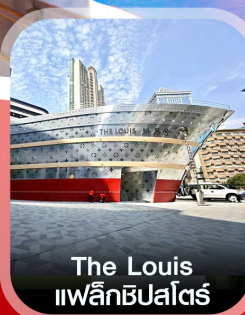
The Louis แพลิกชิปไครส์

คอนเฟิร์ม ออกเดินทาง ทุกพีเรียด 2 ท่านขึ้นไป