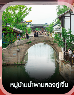
หมู่บ้านน้ำผานหลงกู่เจิน