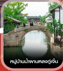
หมู่บ้านน้ำผานหลงกุ่เจิน