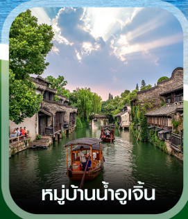
หมู่บ้านน้ำอูเจิน