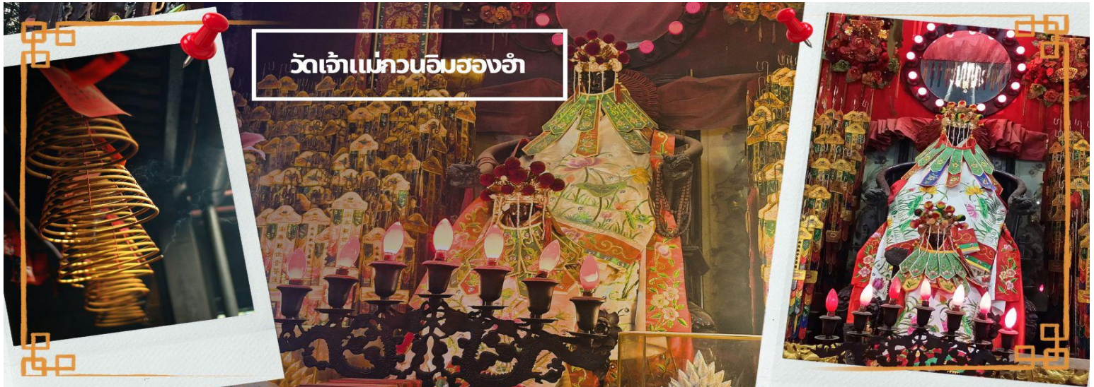
วัดเจ้าแม่กวนอิมของอ้า

ท่านชม โรงงานจิวเวอรี ซึ่งเป็นโรงงานที่มีชื่อเสียงที่สุดของฮ่องกงในเรื่องการออกแบบเครื่องประดับ อาทิเช่น จี้ และแหวนกำหันทน์ ที่สวยงามโดดเด่นไม่มีใครเหมือนใคร ซึ่งถือกำเนิดขึ้นที่นี่และมีชื่อเสียงที่สุดใช้เป็นเครื่องประดับติดตัว และเสริมดวงชะตา สินค้าทุกชิ้นมีเอกสารรับประกันคุณภาพเปลี่ยน ซ่อม ใต้ตลอดอายุการใช้งาน หากเกิดการชำรุดจากสินค้าไม่ใช่อุบัติเหตุ และนำท่านเลือกซื้อ เครื่องประดับที่ ร้านปีเจียะ ซึ่งคนจีนนั้นถือว่าปีเจียะ หรือเผ่เย้า ที่ทำจากหยกที่เป็นตัวแทนของความสวยงามและความบริสุทธิ์ มีความเชื่อว่าหยกมีพลังมงคล เสริมอายุยืนและสุขภาพดี และปีเจียะในตำนานลูกหลานมังกร ช่วยหาเงินหาทอง กินไม่รู้จุกอิม เชื่อว่าเป็นสัตว์นำโชค สู่ครัวเรือน