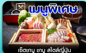
เชิเตาซู ซาซู สีสต์ญี่ปุ่น