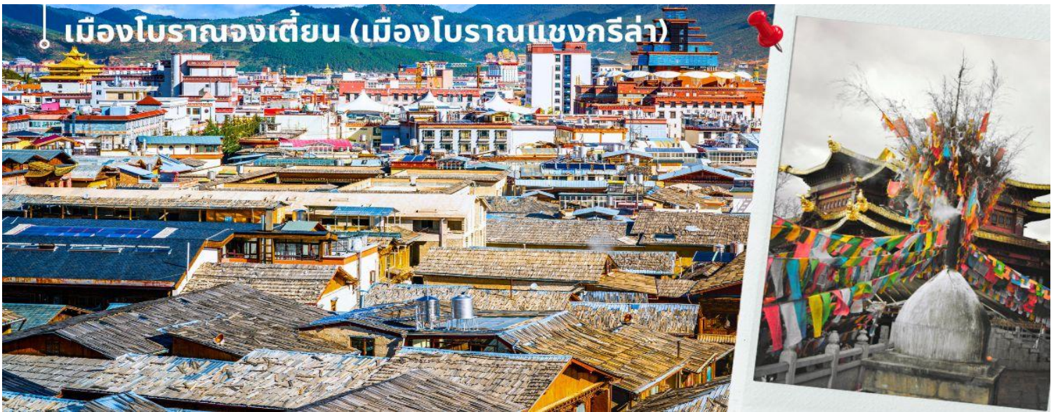
เมืองโบราณจงเตี้ยน (เมืองโบราณแซงกรี่ล่า)

นำท่านชม เมืองโบราณจงเตี้ยน (เมืองโบราณแซงกรี่ล่า) ตั้งอยู่ในเขตปกครองตนเองชนชาติทิเบต ตีซิง ทางตะวันตกเฉียงเหนือของมณฑลยูนนาน ที่ราบสูงทางภาคตะวันตกเฉียงใต้ของประเทศจีน มีชนชาติส่วนน้อย 25 ชนชาติอาศัยกันอยู่ อาทิ ชนชาติทิเบต ลีซอ น่าซี ไป และอี เป็นต้น ศูนย์รวมของวัฒนธรรมชาวทิเบต ลักษณะคล้ายชุมชนเมืองโบราณทิเบต ซึ่งเต็มไปด้วยร้านค้าของคนพื้นเมือง ร้านขายสินค้าที่ระลึกมากมาย