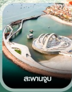
สะพานจูป