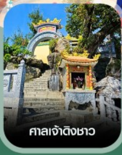
ศาลเจ้าดิ้งซาอว

เช็อินสวนสนุก VinWonders ใหญ่ที่สุดของเวียดนาม นั่งกระเช้าชมวิวข้ามทะเล สวนสนุกฮอนเท็ม ตื่นตาอควาเรียมรูปเต่า อาณาจักรสัตว์น้ำ