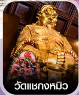
วัดเชกขมวิง

เสริมความปัง การงาน การเงิน โชคลาภ บารมี