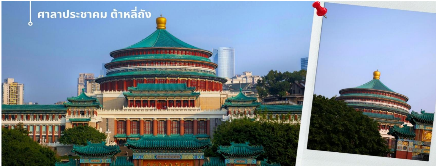
ศาลาประชาชน ต้าหลี่ถิง

นำท่านเดินทางสู่ ศาลาประชาชน เป็นสถานที่หนึ่งในสัญลักษณ์ของเมืองฉงชิ่ง ด้วยสีส้มและรูปแบบการจัดวางอย่างโดดเด่นและลงตัว มีการผสมผสานของศิลปะในยุคราชวงศ์หมิงและราชวงศ์ชิงเข้าไว้ด้วยกัน ด้านหน้าจะเป็นลานกว้าง ในตอนเย็นและตอนกลางคืนจะมีผู้คนจำนวนมากเข้ามาชมตัวกันทำกิจกรรม เดินชมแสงไฟยามค่ำชื่นจัดนิทรรศการต่างๆ