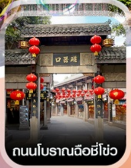
ถนนโบราณฉือชี่โฮ่ว

✈️ คอนเฟิร์ม ออกเดินทาง ทุกพีเรียด 2 ท่านขึ้นไป