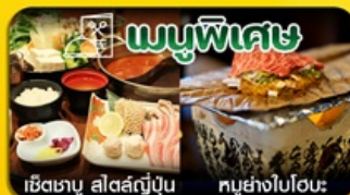
เช็ดเตาบุ สีสสตูปีน พูย่างไปโอะ