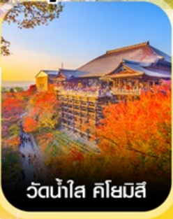
วัตน้ำใส คิโยมิสึ

คอนเฟิร์มออกเดินทาง ทุกพีเรียด 2 ท่านขึ้นไป