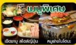
เช็ทเมนูพิเศษ