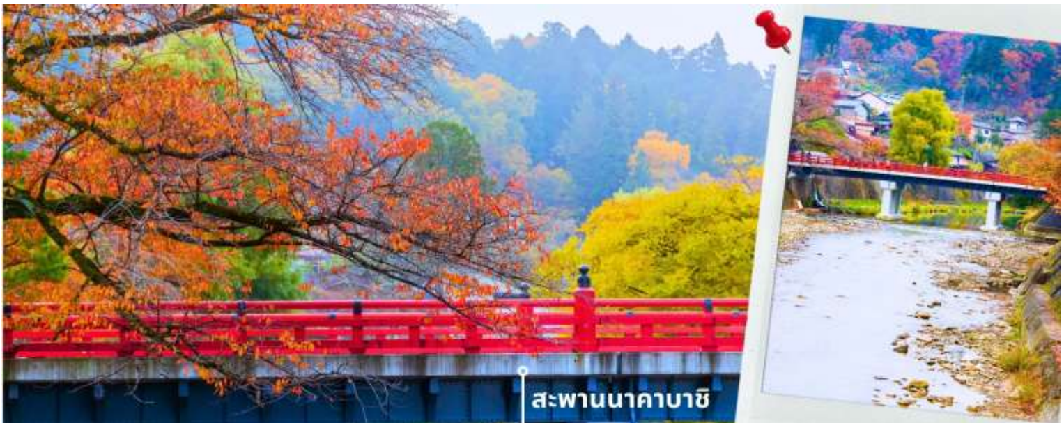
** ระยะเวลาการเปลี่ยนสีขอใบไม้จะขึ้นอยู่กับสายพันธุ์และสภาพอากาศ **

เที่ยง รับประทานอาหารเช้า ณ ภัตตาคาร (2) เมนูพิเศษ เซ็ตหมูย่างใบโอบะ จากนั้นนำท่านเดินทางสู่ เมืองทาคายาม่า ซึ่งเป็นเมืองเล็กๆ ที่ตั้งอยู่ในจังหวัดกิฟุ ที่ห้อมล้อมไปด้วยภูเขาและธารน้ำใส พาท่านแวะถ่ายรูปและชมวิวที่ สะพานนาคาบาชิ เป็นสะพานที่สามารถเห็นได้ชัดอย่างโดดเด่นจากสีที่แดงเข้ม อีกทั้งสะพานแห่งนี้ยังถือเป็นสัญลักษณ์ที่สำคัญจุดหนึ่งของเมือง โดยเฉพาะใบไม้เปลี่ยนสีที่จะมีใบไม้สีส้มสดใสสะพรั่งอยู่รายล้อมตัวสะพาน จนกลายเป็นจุดชมวิวยอดนิยมแห่งหนึ่งของเมืองทาคายาม่า