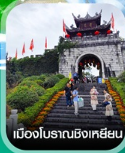
เมืองโบราณชิงเหยียน

✈️ คอนเฟิร์มออกเดินทาง ✈️ ทุกพีเรียด 2 ท่านขึ้นไป