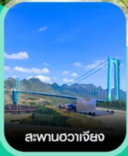
สะพานฮวาเจียง

เช็กอินก่อนใคร สะพานที่สูงที่สุดในโลก สะพานฮวาเจียง น้ำตกหวงกั๋วชู่ หมู่บ้านวู่เจียจ้าย