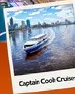
Captain Cook Cruises