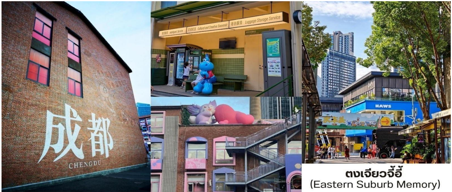
ตงเจี้ยวจี้ (Eastern Suburb Memory)

บาร์ & คราฟต์เบียร์ – ตอนเย็นบรรยากาศคึกคัก เหมาะกับการนั่งชิลฟังดนตรีสดอาหารเสฉวน ( Sichuan Food ) – ร้านอาหารท้องถิ่นจัดเต็มเมนูเผ็ดร้อน เช่น หม่าล่าหม้อไฟ เสฉวนสตรีทฟู้ด สตรีทฟู้ดสไตล์ครีเอทีฟ เช่น ไอศกรีม โฮมเมด ขนมอบ แชนด์วิซพิวซันและของกินเล่นที่เหมาะกับการเดินช้อปปิ้งเพลิน ๆ