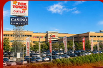
ฟ็อกซ์ทาวน์ เอาท์ลีค