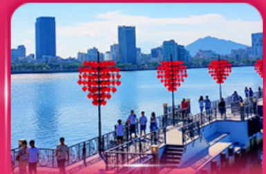
สะพานแห่งความรัก