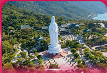
องค์กวนอิม วัดหลินอึ้ง