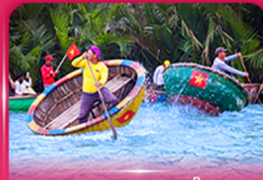
ล่องเรือกระดัง หมู่บ้านกิมทาน