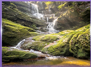
น้ำตกสายทิพย์