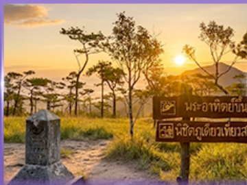
ชมพระอาทิตย์ขึ้น กุสอยดาว