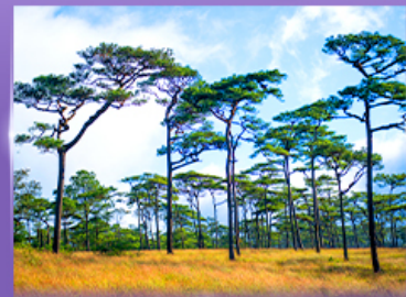
ลานสนกุสอยดาว