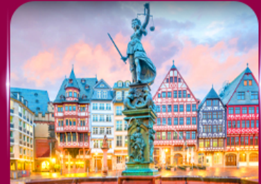
จัตุรัสโรเมอร์ แพรงก์เฟิร์ต