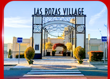
Las Rozas Village เอากีเลียน