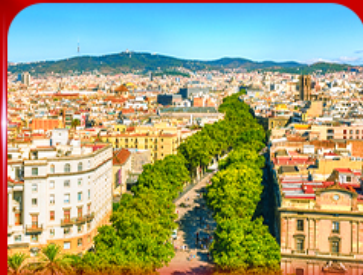
ลาริมบลาสตริก บาร์เซโลนา