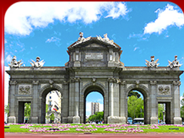
เข็ควินประตูอัลกาลา มาดริด