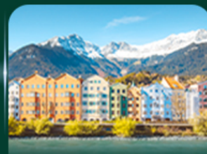
วาการ์สึลูกวาด อินส์บรุค