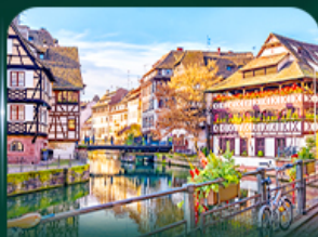
เทียวัลซาซ สตราสบูร์ก