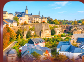
ย่านเมืองเก่า ลักเซมเบิร์ก