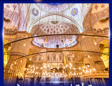
เข้าชมความงามสุเหร่าสีน้ำเงิน