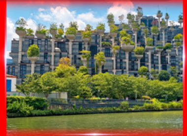
ตึก 1,000 ต้นไม้