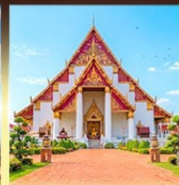
วิหารพระมงคลมิ่งมิตร