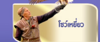
โชว์เหยี่ยว