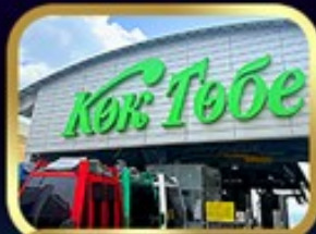
ซินโทโกโทเบมวิอัลมาตี

นั่งกระเช้าชิมบุลัก • ทะเลสาบโคลโซ • ชารินเกรนด์แคนอน