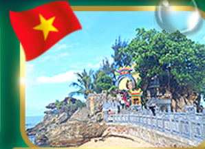
สักการะขอพรศาลเจ้าดิวงกา