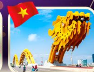
สะพานมังกร ดานัง