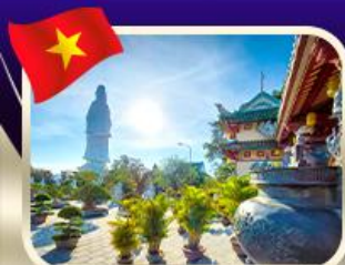
ขอพรทวนอิมวัดหลินอึ้ง