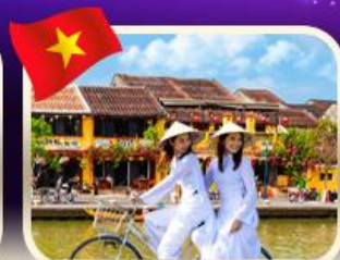
เช่าจักรยานเมืองเก่าฮอยอัน