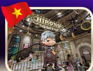
POPMART บานาฮิลล์