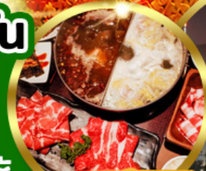
บุฟเฟต์ชาบู