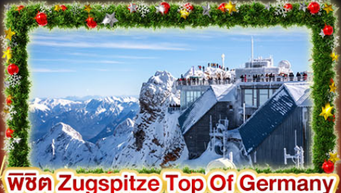
พีชิต Zugspitze Top Of Germany