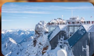
พีชิต Zugspitze Top Of Germany