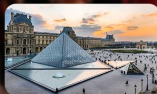
เข้าชมพิพิธภัณฑ์ลูฟวร์