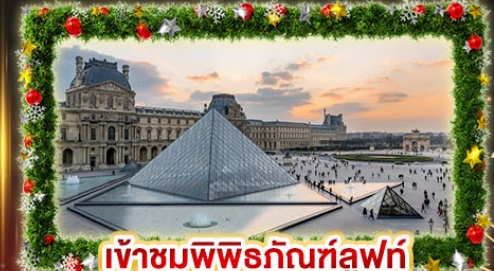
เข้าชมพีระมิดที่ลูฟร์