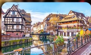
La Petite France Colmar