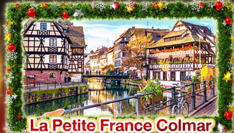
La Petite France Colmar