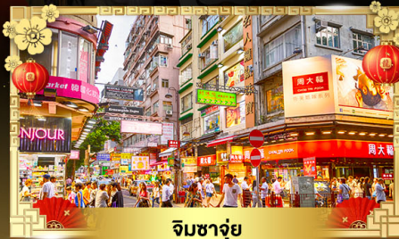
จิมซาจุ่ย