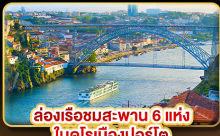
ล่องเรือชมสะพาน 6 แห่ง ในคูโรเมืองปอร์โต