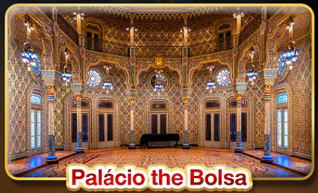
Palácio the Bolsa

เดินทาง : 01-10 พ.ค. | 29-07 มิ.ย. | 09-18 ต.ค. 69