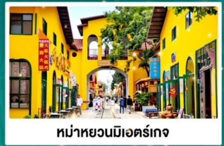
หมู่บ้านมiaohe