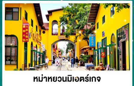
หมู่บ้านมิตร์เกจ