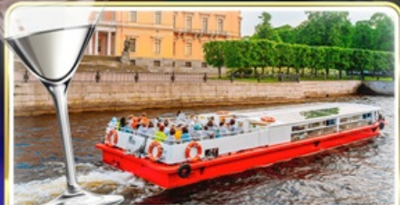
ล่องเรือแม่น้ำเนวา พร้อมเสิร์ฟ Vodka Tasting