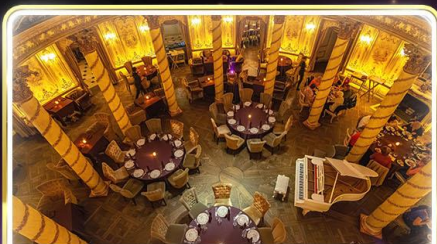
ทานอาหารสุดหรู ภัตตาคาร Turandot