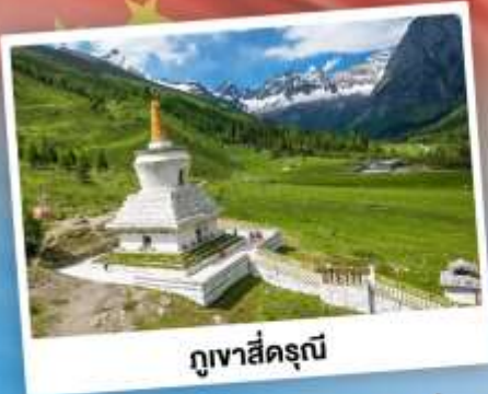
กู๋เจาสื่อตรุณี

เที่ยว 2 อุทยาน กู๋เจาสื่อตรุณี & ปี้ฝิงโกว เดินชมหมีแพนด้าสุดน่ารัก ใกล้ชิดกับแพนด้าแดง