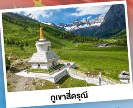
กู๋เจาสีครุณี

เที่ยว 2 อุทยาน กู๋เจาสีครุณี & ปี้ฝิงโกว เดินชมหมีแพนด้าสุดน่ารัก ใกล้ชิดกับแพนด้าแดง