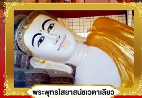
พระพุทธรไสยาสน์ชเวตาเลียว