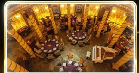
ทานอาหารสุดหรู ภัตตาคาร Turandot