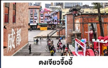
ตงเจียวจ้ออี้