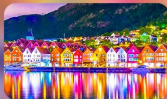
ฟัทเบอร์เกิน 1 คืน