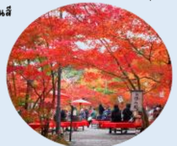
ที่ให้ภาพบรรยากาศที่งดงามของลานหนึ่งสีแดง ที่ปกคลุมไปด้วยใบไม้เปลี่ยนสี