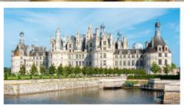
เข้าชมพระราชวังซ็องบอร์