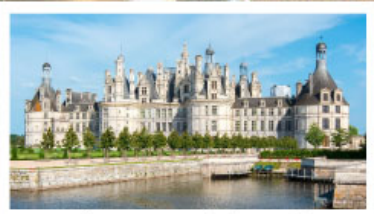
เข้าชมพระราชวังซ็องบอร์