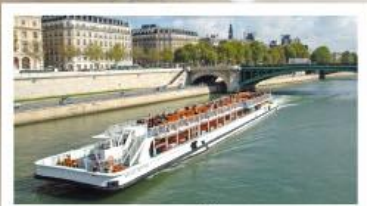
ล่องเรือแม่น้ำแชนน์