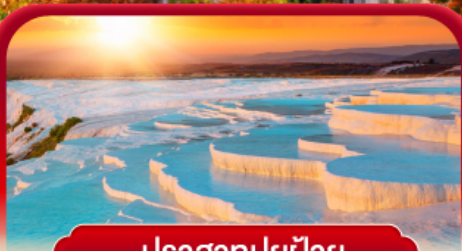
ปราสาทปูยฝ้าย