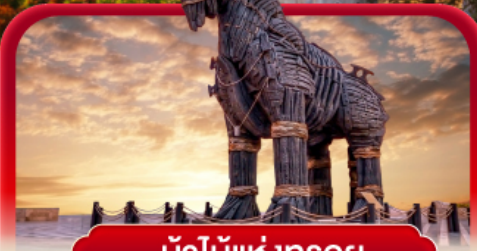
ม้าไม้แห่งทรอย