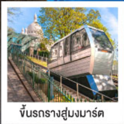
ขึ้นรางสู่สมมาร์ต