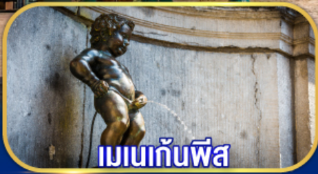
เมเนกั้นพีส