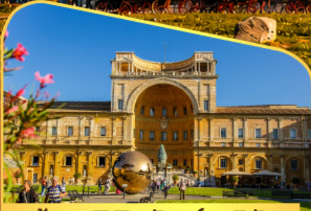
เข้าชมพีพีรภัณฑวาทิกัน