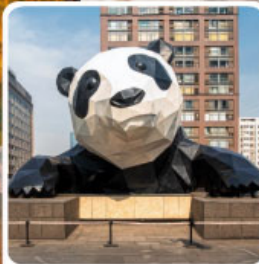
หมีแพนด้ายักษ์ป็นติก