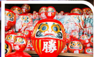
วัดแห่งชัยชนะ: วัดคัตสึโอจิ (วัดคารุมะ)