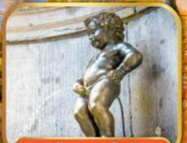
ทูน้อยมานเทินพิส