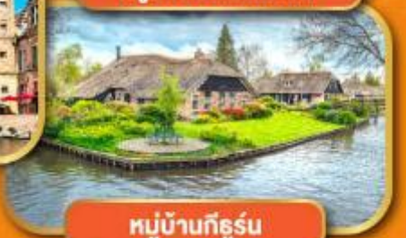
หมู่บ้านก็ธูร์น