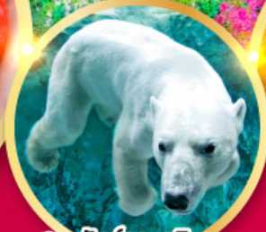
สวนสัตว์อาซาฮิยามะ