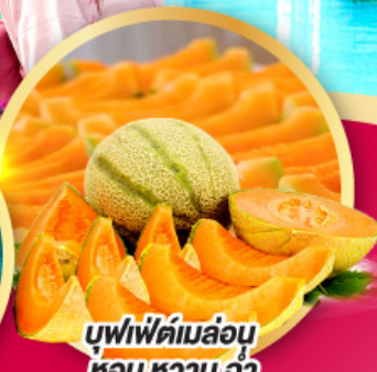
บุฟเฟ่ต์ผลไม้ หอมหวาน ฉ่ำ