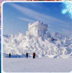
งานแกะสลัก เกาะพระอาทิตย์