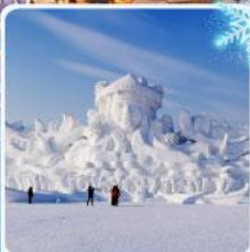
งานแกะสลัก เกาะพระอาทิตย์