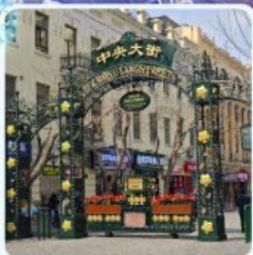
ถนนจงยาง