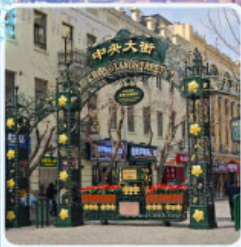
ถนนจงยาง