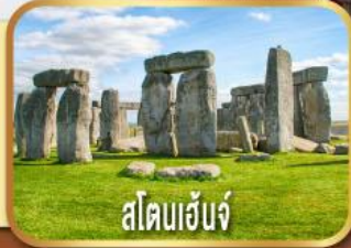
สโตนเฮ็นจ์