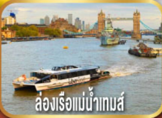
ล่องเรือแม่น้ำเทมส์