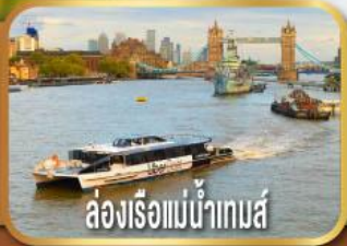
ล่องเรือแม่น้ำเทมส์