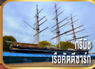
กรีนวิช เรือคัตตีซาร์ก

ชมเมืองลิเวอร์พูล พร้อมถ่ายรูป หน้าสนามแอนฟิลด์