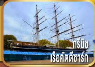
กรีนวิช เรือคัตตีซาร์ก

ชมเมืองลิเวอร์พูล พร้อมถ่ายรูป หน้าสนามแอนฟิลด์